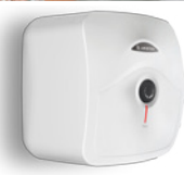
/ ANDRIS R 10-15-30 I