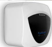
/ ANDRIS LUX ECO 10-15-30 I