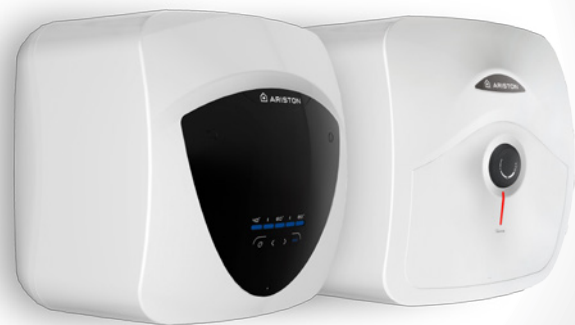
/ ANDRIS LUX ECO 10-15-30 l